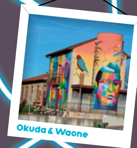
Okuda & Waone