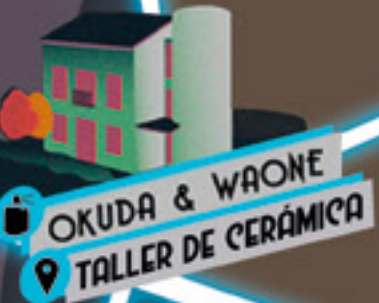
OKUDA & WAONE TALLER DE CERÁMICA