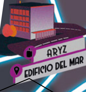
ARYZ EDIFICIO DEL MAR