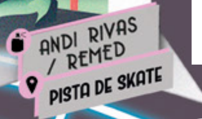
ANDI RIVAS / REMED PISTA DE SKATE